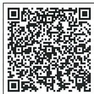
2023全民國防應變手冊 QR碼